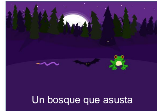
Un bosque que asusta