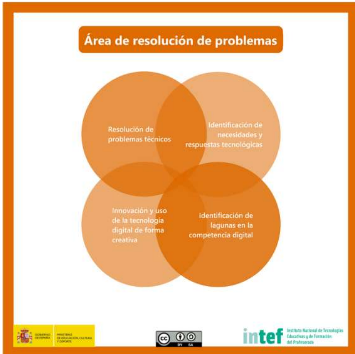
Figura 7 - Área de resolución de problemas

Identificar necesidades de uso de recursos digitales, tomar decisiones informadas sobre las herramientas digitales más apropiadas según el propósito o la necesidad, resolver problemas conceptuales a través de medios digitales, usar las tecnologías de forma creativa, resolver problemas técnicos, actualizar su propia competencia y la de otros.