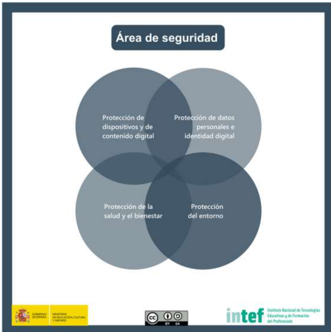
Figura 6 - Área de seguridad

Protección de información y datos personales, protección de la identidad digital, de los contenidos digitales, medidas de seguridad, uso responsable y seguro.