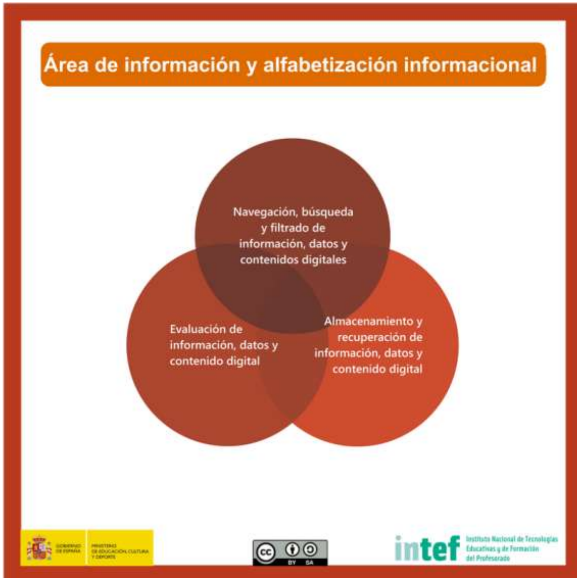
Figura 3 - Área de información y alfabetización informacional

Identificar, localizar, obtener, almacenar, organizar y analizar información digital, datos y contenidos digitales, evaluando su finalidad y relevancia para las tareas docentes.