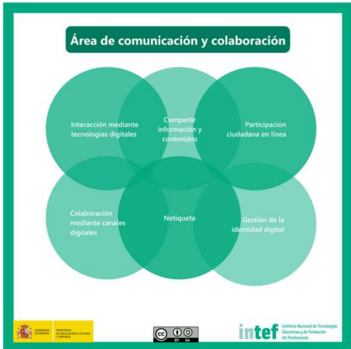
Figura 4 - Área de comunicación y colaboración

Comunicar en entornos digitales, compartir recursos a través de herramientas en línea, conectar y colaborar con otros a través de herramientas digitales, interactuar y participar en comunidades y redes; conciencia intercultural.