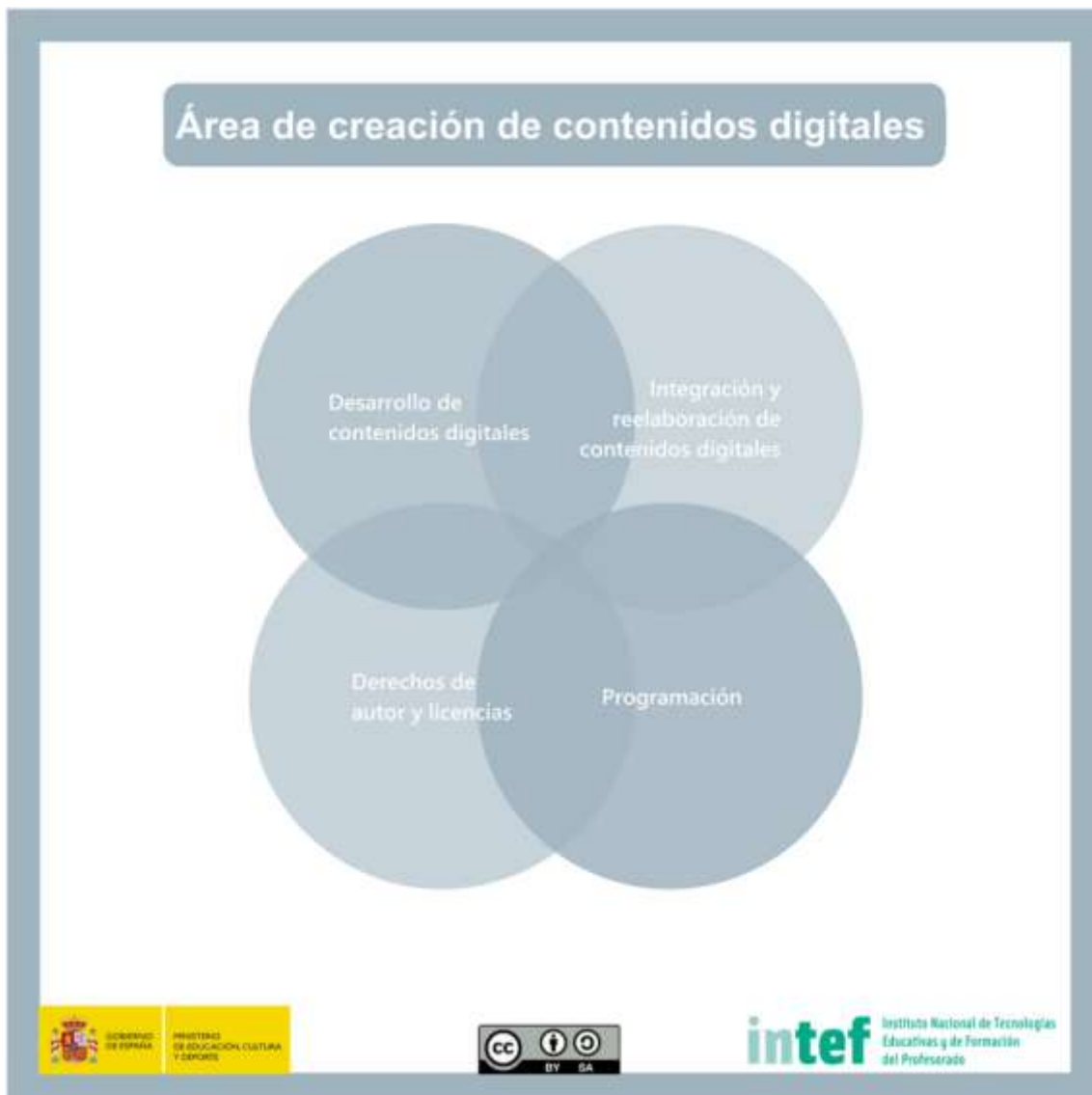
Figura 5 - Área de creación de contenidos digitales

Crear y editar contenidos digitales nuevos, integrar y reelaborar conocimientos y contenidos previos, realizar producciones artísticas, contenidos multimedia y programación informática, saber aplicar los derechos de propiedad intelectual y las licencias de uso.